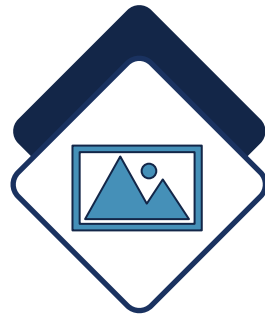
Imagen como método de enseñanza